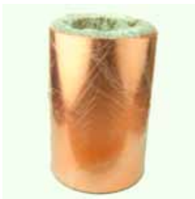
負極用集電体として