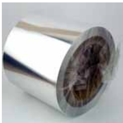
正極用集電体として