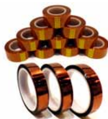
絶縁処理用途として