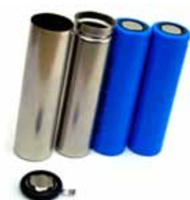
円筒缶、角管、コインセル部品など