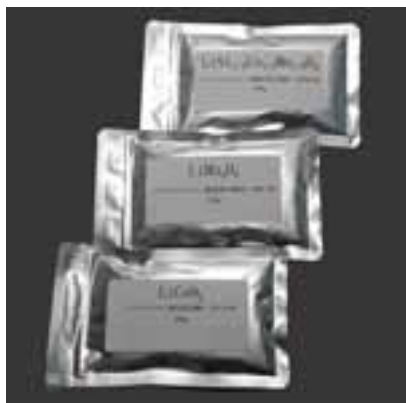
LiCoO 2 , LiMn 2 O 4 , LiNi 1/3 Co 1/3 Mn 1/3 O 2 MCMB, Li 4 Ti 5 O 12 , Si負極材料など