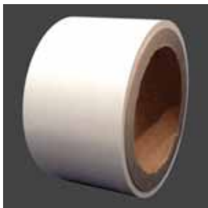
PP、ペーパー、アラミドなど