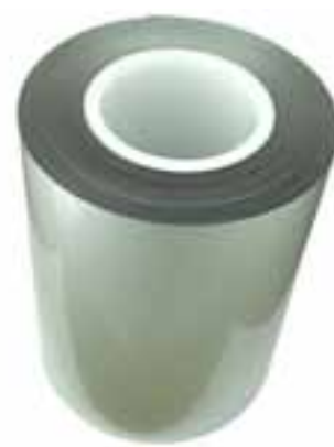
ラミネートセル包材として