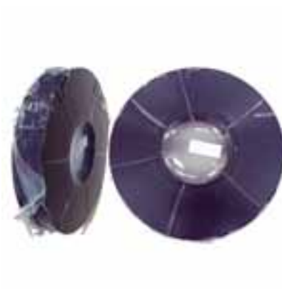
ラミネートセル用封止材として